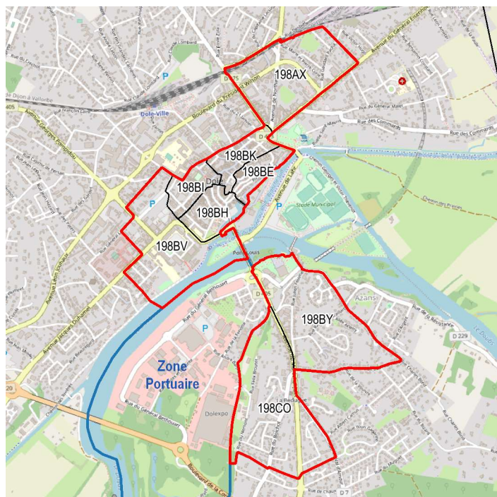
Centre-ville de Dole